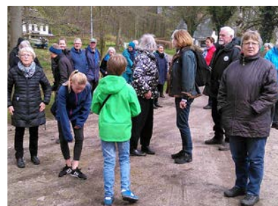
Pilgrimsvandring med TeamØst i Kollund Skov april 2016