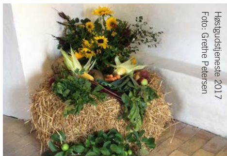
Høstgudstjeneste 2017