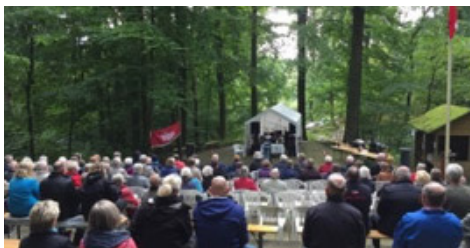
2. pinsedag 2017, Padborg Friluftscene

Menighedsrådet henviser til provstiets friluftsgudstjenester ved Sønderstrand i Aabenraa eller ved Friluftscenen i Padborg. Sidstnævnte er kl. 14.00 og er et samarbejde mellem Bov sogn, Holbøl sogn og Nordschleswigsche Gemeinde. Præster fra alle tre menigheder medvirker sammen med Frøslev Mandskor.