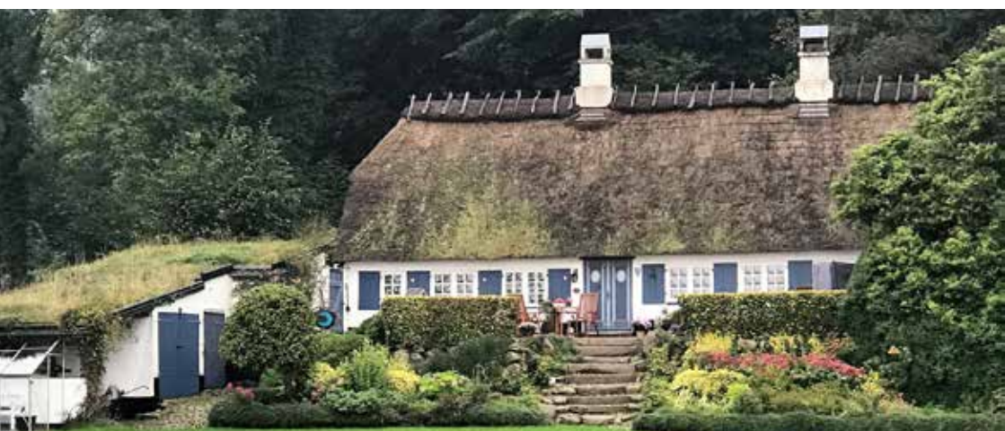
Dansk-Nordisk Ungdomsforbunds hus - som det så ud i 1945 - og nu