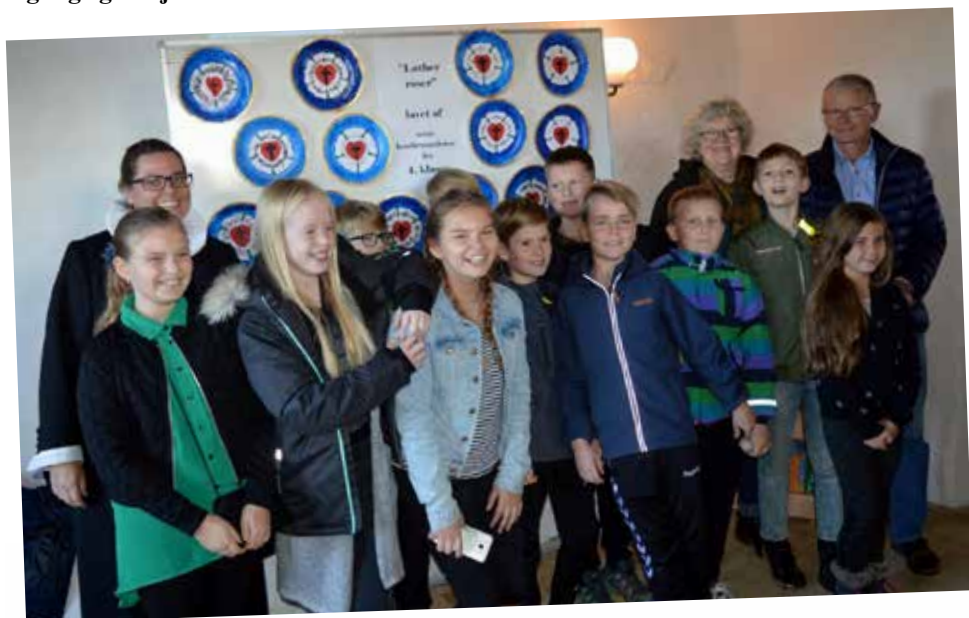
Minikonfirmandernes Lutherrosen var hængt op i våbenhuset.

Søndag den 29. oktober havde vi Luther lagkage gudstjeneste.