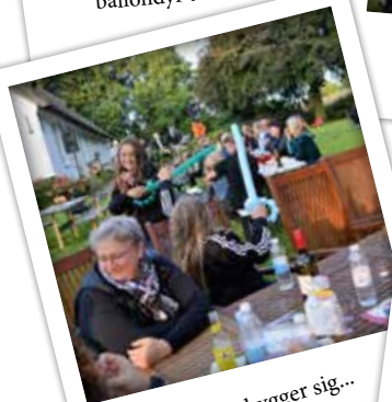
tilskuerne hygger sig...