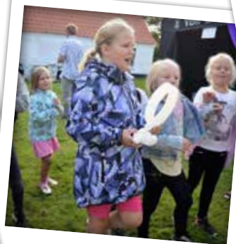
... flere ballondyr