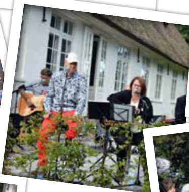
... god musik