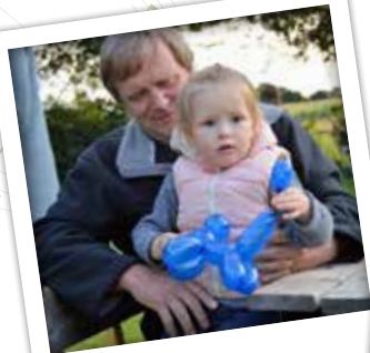
ballondyr til de små ...