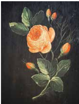
Blomsterbillede fra Løjt kirke

I Danmarks Kirker beskrives disse malerier som ”brogede, sløjfebundne blomsterbuketter på mørk bund”, og der findes i Løjt Kirke på nord pulpituret tilsvarende blomsterbuketter malet af den sønderjyske maler. Det er smukke blomsterbilleder, man ser i Varnæs, og de er fint placeret, så de kan nydes, når man går ned ad gangen fra koret. Jes Jessen udsmykkede fra 1765 altertavler, pulpiturer og stolestader i 15 østsønderjyske kirker.