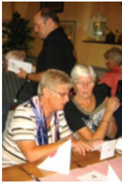
Hvad skal vi have at drikke?

Vel ankommet til Lybeck spiste vi middag i Kartoffelkælderen.