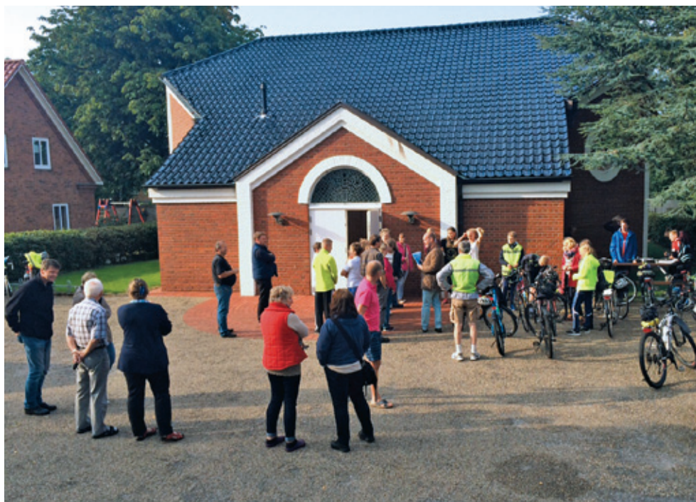
Konfirmandernes cykeltur: Varnæs-Husum tur-retur, den 11.-13. september 2015.