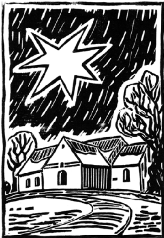
Radering af Mogens Mølskov (2004)