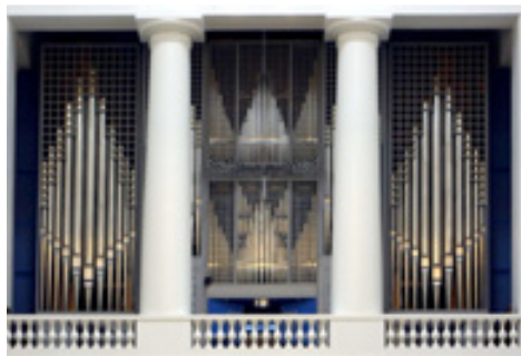
Det store Marcussen orgel i Vor Frue Kirke, København

Der indledes og afsluttes med et præludium og et postludium, hvor en af vores meget kompetente og dygtige organister fremfører musik, der nøje er tilpasset dagens tekst og kirkeårets gang. I fastetiden spilles stille, indadvendt musik - så afløses denne slags musik med påskens mange festlige musikstykker - og nu efter påske er der igen anderledes orgelmusik, der peger frem mod pinsetiden.. Således tilpasses musikken kirkeårets gang med de store højtider jul, påske, pinse som centrale udgangspunkter. Og vi har fremragende kirke musikere i Danmark. En nydelse at høre det store orgel spille med skiftende organister.