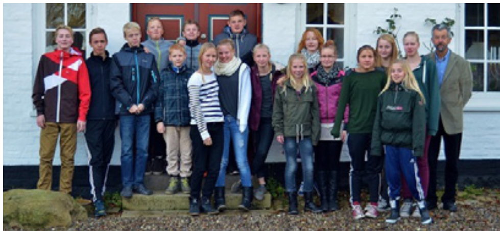
Årets konfirmander.