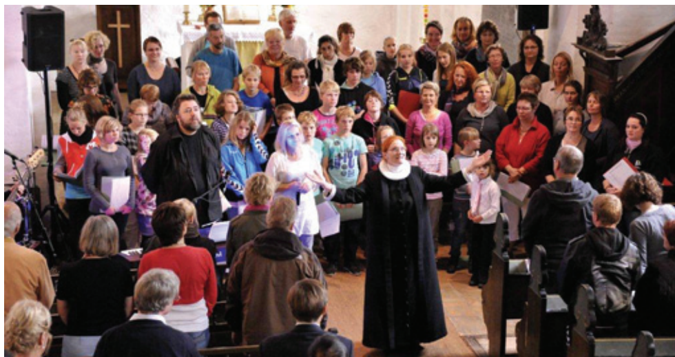
Konfirmanderne medvirker ved gospelkoncerten i Satrup kirke 18. september.