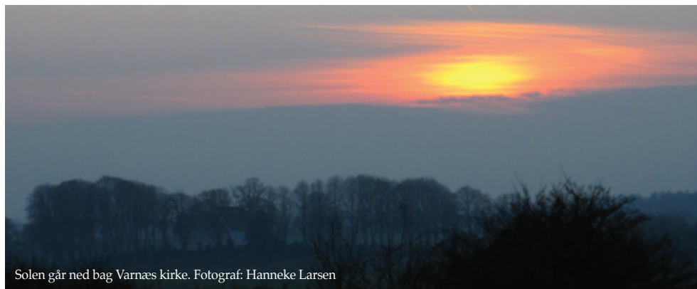
Solen går ned bag Varnæs kirke.