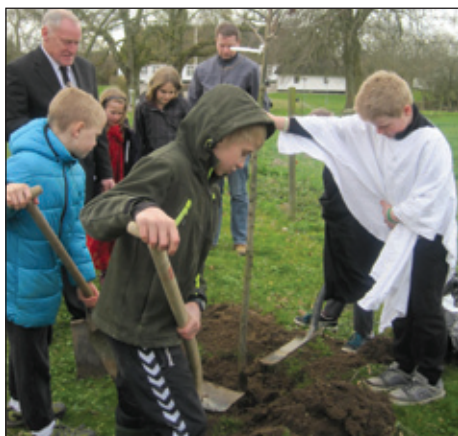
Eg plantes mellem kirken og præstegården.

Det er godt, de har været i kirken allerede i børnehaven. Her har de fået den første indsigt. Samarbejdet og velvilje fra børnehavens side betyder meget. Kirken er ikke bare en bygning, de kører forbi, men helt fra børnehaven ved de, hvad der sker inde i den. Når de så kommer i 4. klasse, får de nogle oplysninger. Nogle har bedsteforældre begravet på kirkegården. Det er en stor ny verden, de kommer ind i. Og der er så meget, de kan finde på at spørge om. De er ikke bange for at sige noget. Og alt imens udvikler de sig til at forstå nogle ting. Og jeg glemmer ikke, hvad en sagde, da Povl sagde, at jeres far i himlen er bedre end jeres far på jorden: "jeg er nu godt tilfreds med min far, som han er".