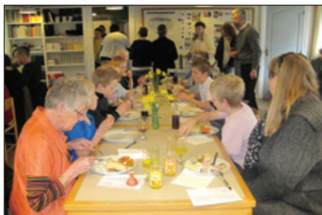
Afslutning med forældre og bedsteforældre.